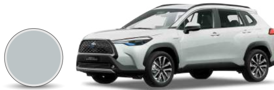
089 | Platino blanco perla