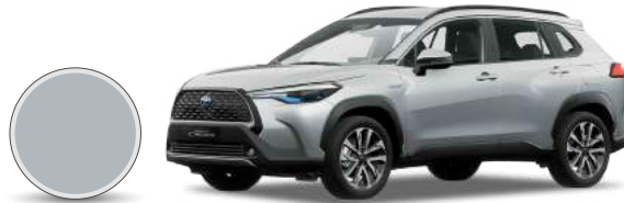
1H6 | Plateado metálico