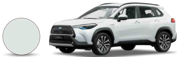
040 | Blanco