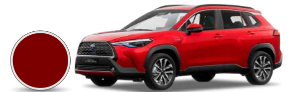
3R3 | Rojo metálico