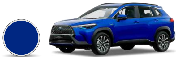
8X2 | Nébula azul metálico