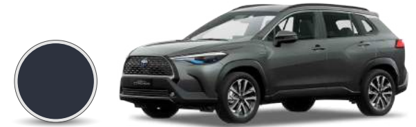
1G3 | Gris metálico