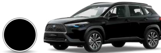
215 | Negro